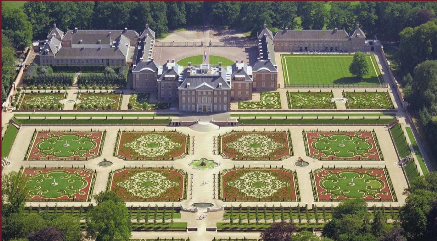
Apeldoorn Paleis Het Loo