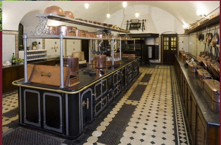
Haarzuilens Kasteel De Haar